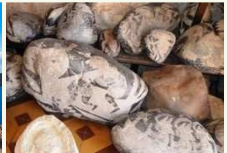
"Steine von Ica" - Museo Cabrera