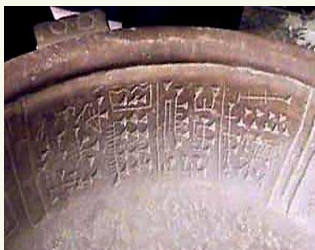
Fuente Magna Bowl