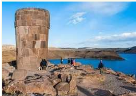
Chullpas von Sillustani